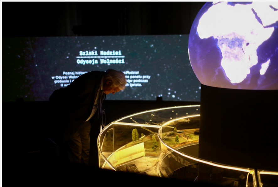
Warszawa, Cytadela Warszawska