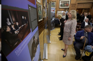
Wystawa IPN „Szlaki Nadziei. Odyseja Wolności” w Nowym Jorku – 8 listopada 2023.