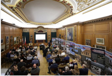
Wystawa IPN „Szlaki Nadziei. Odyseja Wolności” w Nowym Jorku – 8 listopada 2023.