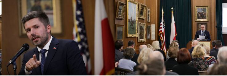
Wystawa IPN „Szlaki Nadziei. Odyseja Wolności” w Nowym Jorku – 8 listopada 2023.