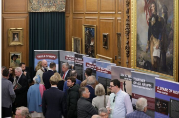
Wystawa IPN „Szlaki Nadziei. Odyseja Wolności” w Nowym Jorku – 8 listopada 2023.