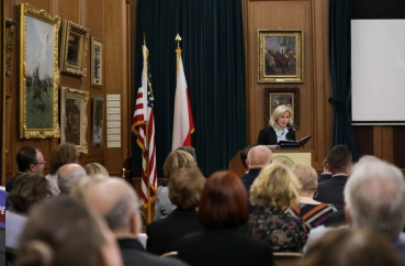
Wystawa IPN „Szlaki Nadziei. Odyseja Wolności” w Nowym Jorku – 8 listopada 2023.