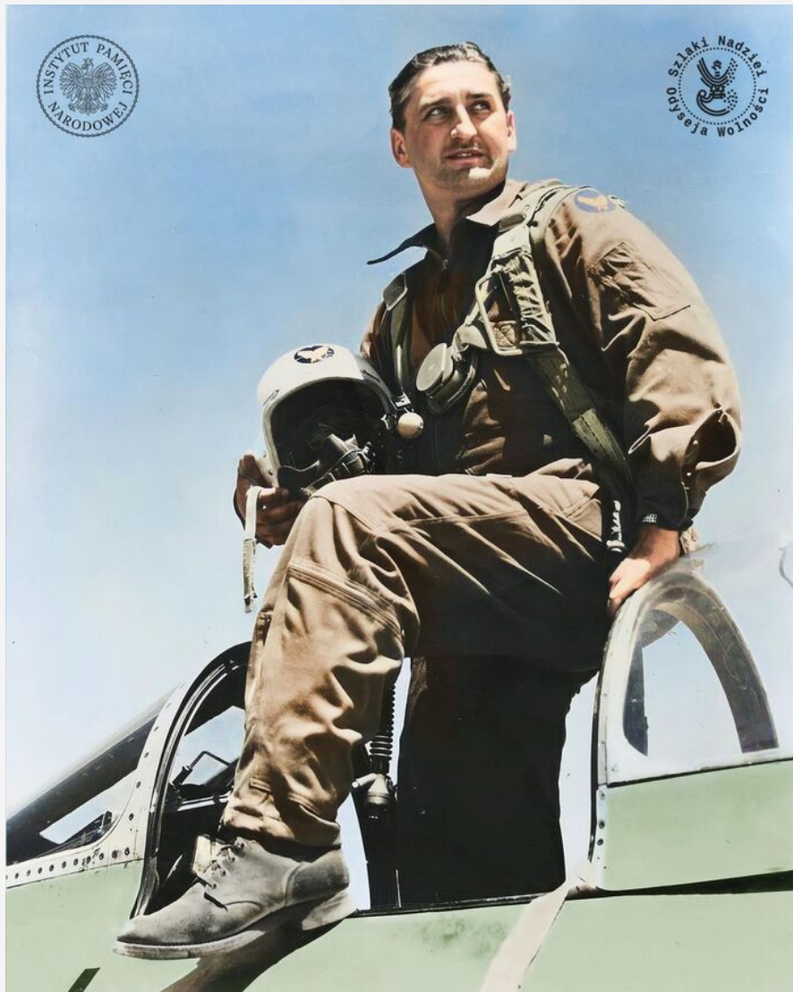
Franciszek „Gabby” Gabryszewski (1919 - 2002)

Amerykański oficer pochodzenia polskiego, as myśliwski, nazywany przez kolegów „Gabby”.