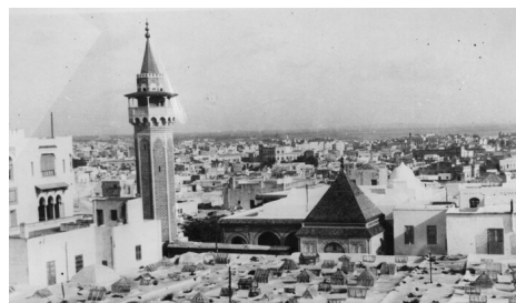
Tunis, listopad 1942 r.