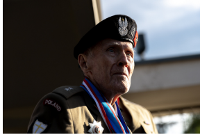
W Bolonii oddaliśmy hołd żołnierzom 2. Korpusu Polskiego - 24 kwietnia 2025. Fot. 13 Sławek Kasper (IPN)