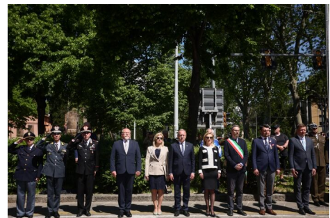
W Bolonii oddaliśmy hołd żołnierzom 2. Korpusu Polskiego - 24 kwietnia 2025. Fot. 3 Sławek Kasper (IPN)