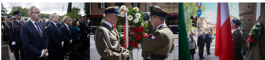
W Bolonii oddaliśmy hołd żołnierzom 2.