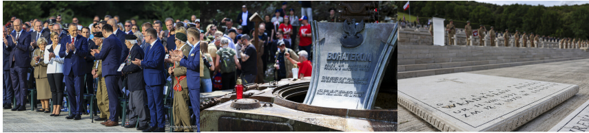
Obchody 82. rocznicy bitwy o Monte Cassino - 18 maja 2026. Fot. 13 Mikołaj Bujak (KPRP)

2. Korpus Polski od 15 czerwca 1944 r. rozpoczął działania nad Adriatykiem. Dywizje niemieckie stawiały opór na kolejnych pozycjach, wykorzystując przepływające rzeki. Na początku lipca 1944 r. Polacy zdobyli Loreto, Recanati, Osimo, Castelfidardo i wzgórze San Pietro oraz podeszli pod Ankonę.