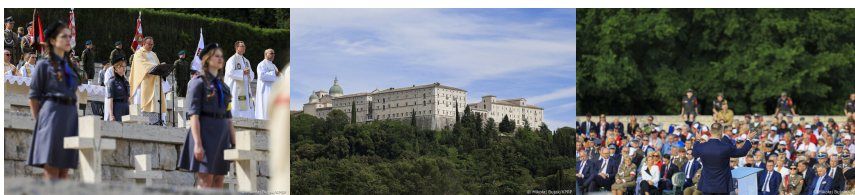
Obchody 82. rocznicy bitwy o Monte Cassino