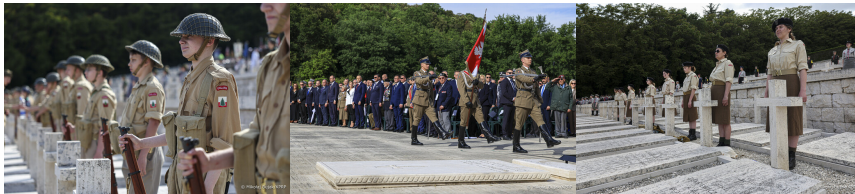
Obchody 82. rocznicy bitwy o Monte Cassino - 18 maja 2026. Fot. 2 Mikołaj Bujak (KPRP)