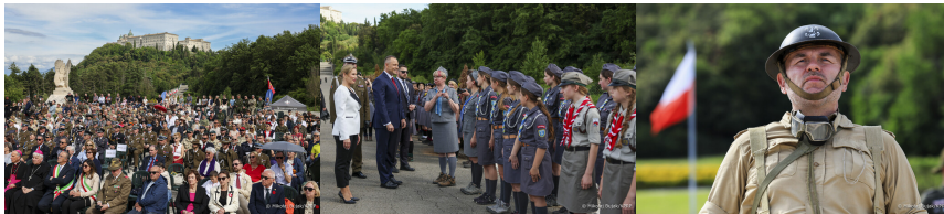
Obchody 82. rocznicy bitwy o Monte Cassino - 18 maja 2026. Fot. 5 Mikołaj Bujak (KPRP)