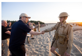
Tobruk 1941. Przystanek Żywej Historii na Pustyni Biedowskiej. Fot. 4 Sławek Kasper (IPN)