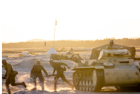
Tobruk 1941. Przystanek Żywej Historii na Pustyni Biedowskiej. Fot. 13 Sławek Kasper (IPN)