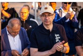
Tobruk 1941. Przystanek Żywej Historii na Pustyni Biedowskiej. Fot. 2 Sławek Kasper (IPN)