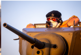
Tobruk 1941. Przystanek Żywej Historii na Pustyni Biedowskiej. Fot. 11 Sławek Kasper (IPN)