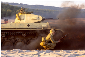
Tobruk 1941. Przystanek Żywej Historii na Pustyni Biedowskiej. Fot. 10 Sławek Kasper (IPN)