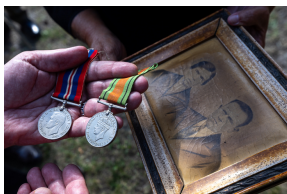
Tobruk 1941. Przystanek Żywej Historii na Pustyni Biedowskiej. Fot. 16 Sławek Kasper (IPN)