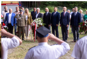
Tobruk 1941. Przystanek Żywej Historii na Pustyni Biedowskiej. Fot. 14