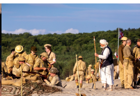
Tobruk 1941. Przystanek Żywej Historii na Pustyni Biedowskiej. Fot. 3 Sławek Kasper (IPN)