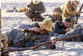
Tobruk 1941. Przystanek Żywej Historii na Pustyni Biedowskiej.