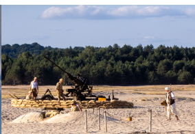
Tobruk 1941. Przystanek Żywej Historii na Pustyni Biedowskiej. Fot. 6 Sławek Kasper (IPN)