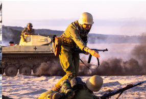
Tobruk 1941. Przystanek Żywej Historii na Pustyni Biedowskiej. Fot. 9