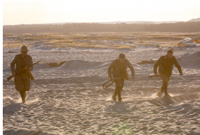
Tobruk 1941. Przystanek Żywej Historii na Pustyni Biedowskiej. Fot. 7 Sławek Kasper (IPN)