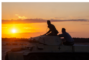
Tobruk 1941. Przystanek Żywej Historii na Pustyni Biedowskiej. Fot. 1 Sławek Kasper (IPN)

Współorganizatorem wydarzenia była Gmina Klucze. Wśród partnerów znalazły się: Muzeum Lotnictwa Polskiego w Krakowie, Muzeum Armii Krajowej, 2 Korpus Polski, Wojska Specjalne, Nadleśnictwo Olkusz.