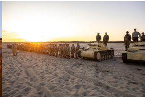
Tobruk 1941. Przystanek Żywej Historii na Pustyni Biedowskiej. Fot. 12