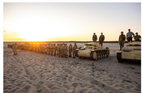
Tobruk 1941. Przystanek Żywej Historii na Pustyni Biedrowskiej; Fot. 12 Sławek Kaspar (IPN)