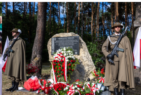
Tobruk 1941. Przystanek Żywej Historii na Pustyni Biedowskiej. Fot. 15