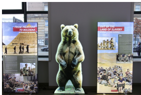
Wystawa „Szlaki Nadziei. Odyseja Wolności” w Centrum Edukacyjnym IPN im. Janusza Kurtyki - Warszawa, 2026 r. Fot. 7