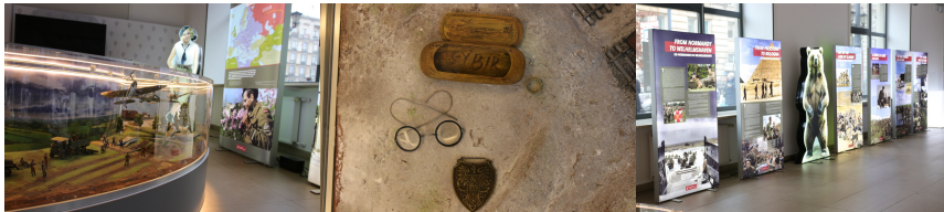
Wystawa „Szlaki Nadziei. Odyseja Wolności” w Centrum Edukacyjnym IPN im. Janusza Kurtyki - Warszawa, 2026 r. Fot. 4 Agnieszka Szajewska (IPN)