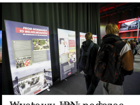
Wystawy IPN podczas Kongresu Przyszłości Narodowej Łódź Fot. 3