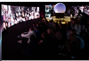
Wystawy IPN podczas Kongresu Przyszłości Narodowej Łódź Fot. 2