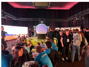
Wystawy IPN podczas Kongresu Przyszłości Narodowej Łódź