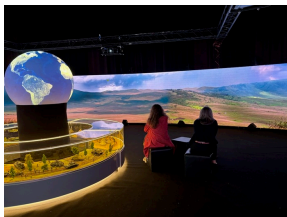
Wystawy IPN podczas Kongresu Przyszłości Narodowej Łódź Fot. 3