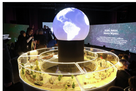
Wystawy IPN podczas Kongresu Przyszłości Narodowej - Łódź, 15 października 2025.