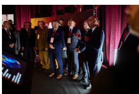
Wystawy IPN podczas Kongresu Przyszłości