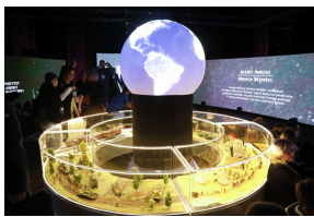
Wystawy IPN podczas Kongresu Przyszłości Narodowej - Łódź, 15 października 2025.