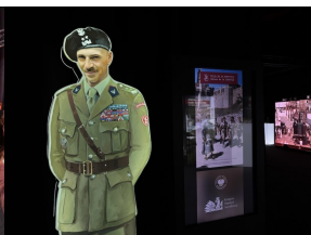
Wystawy IPN podczas Kongresu Przyszłości Narodowej Łódź