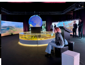
Wystawy IPN podczas Kongresu Przyszłości Narodowej Łódź Fot. 2 Kornelia Zaborska (IPN)