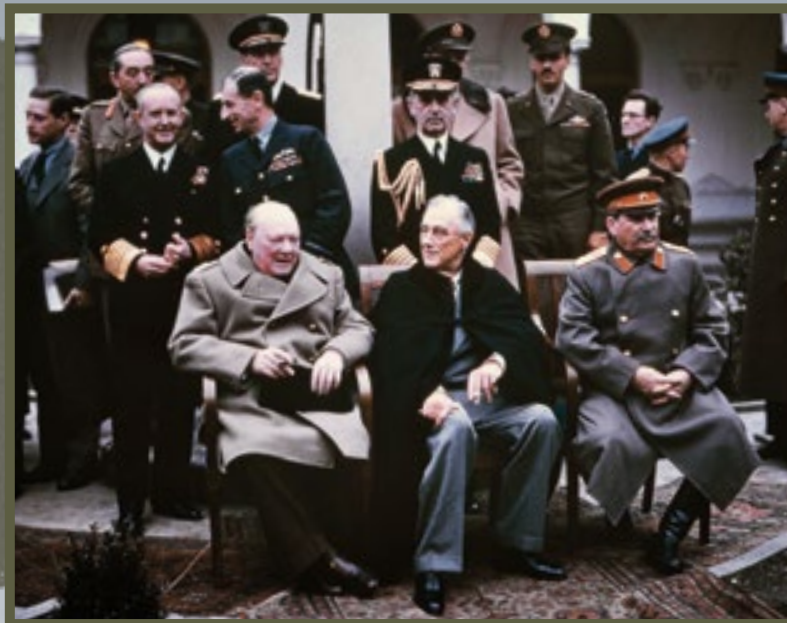
☞ Az 1945-ös jaltai konferencia. Balról ül: Winston Churchill brit miniszterelnök, Franklin Delano Roosevelt amerikai elnök, Joszif Sztálin szovjet vezető

Tragiczna śmierć gen. Władysława Sikorskiego w katastrofie w Gibraltarze w lipcu 1943 r. osłabiła pozycję polskiego rządu w Londynie. Po bitwie stalingradzkiej Józef Stalin rósł w siłę i zaczął tworzyć podporządkowane sobie komunistyczne struktury przyszłego państwa polskiego, całkowicie zależnego od ZSRS. W lutym 1945 r. żołnierze służący w Polskich Siłach Zbrojnych poznali ustalenia konferencji jaltańskiej, której uczestnicy zgodzili się na oddanie Polski w sowiecką strefę wpływów, odebranie jej Kresów Wschodnich i odsunięcie od władzy legalnego rządu na uchodźstwie. Informacje te doprowadziły do kryzysu w stosunkach polsko-brytyjskich. Żołnierze polscy uczestniczyli jednak w wojnie aż do kapitulacji Niemiec. Mimo wielu sukcesów odniesionych w walkach na frontach II wojny światowej, bohaterstwa, a nawet heroizmu i ofiar żołnierze Polskich Sił Zbrojnych nie wzięli udziału w defiladzie zwycięstwa w Londynie 8 czerwca 1946 r. Gabinet brytyjski nie zaprosił ich do udziału w tym wydarzeniu, obawiając się negatywnej reakcji zdominowanego przez komunistów rządu w Warszawie.