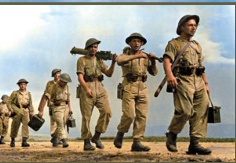
📍 A lengyel hadsereg katonái keleti gyakorlatra indulnak Żołnierze Armii Polskiej na Wschodzie w drodze na ćwiczenia