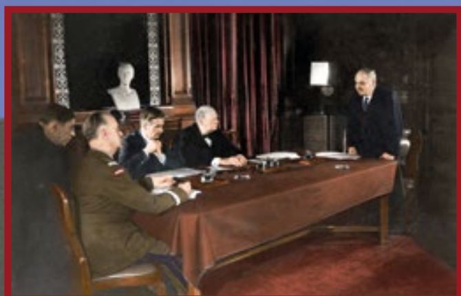
☞ A Sikorski-Majszki egyezmény aláírása, amely helyreállította a diplomáciai kapcsolatokat Lengyelország és a Szovjetunió között. London, 1941. VII. 30.

Podpisanie układu Sikorski-Majski przywracającego stosunki dyplomatyczne między Polską a ZSRS, Londyn, 30 VII 1941 r.