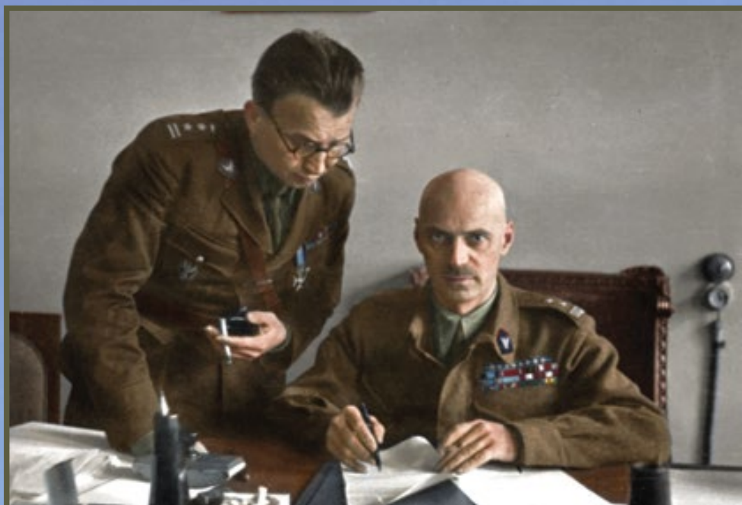
☞ Władysław Anders tábornok (a Szovjetunióban állomásozó lengyel hadsereg parancsnoka) és Leopold Okulicki ezredes (a Szovjetunióban állomásozó lengyel hadsereg vezérkari főnöke). 1941–1942

30 lipca 1941 r. w Londynie został podpisany układ polsko-sowiecki, który przywracał między innymi wzajemne stosunki dyplomatyczne. Jego skutkiem była amnestia dla obywateli polskich znajdujących się na terenie ZSRS. Pozwoliło to na zwolnienie tysięcy ludzi z obozów i miejsc zesłania. 14 sierpnia zawarto umowę wojskową, która określała zasady funkcjonowania w ZSRS Armii Polskiej stanowiącej część Polskich Sił Zbrojnych. W sercach wielu Polaków pojawiła się nadzieja na powrót do domu. Na czele armii stanął, zwolniony z więzienia sowieckiego, gen. Władysław Anders. Podczas wizyty w Moskwie Naczelnego Wodza gen. Władysława Sikorskiego w grudniu 1941 r. postanowiono, że Armia Polska zostanie rozbudowana, a następnie skierowana na front. Równoległe władze polskie rozpoczęły intensywne poszukiwania oficerów wziętych przez Sowietów do niewoli w 1939 r. i osadzonych w obozach specjalnych NKWD.