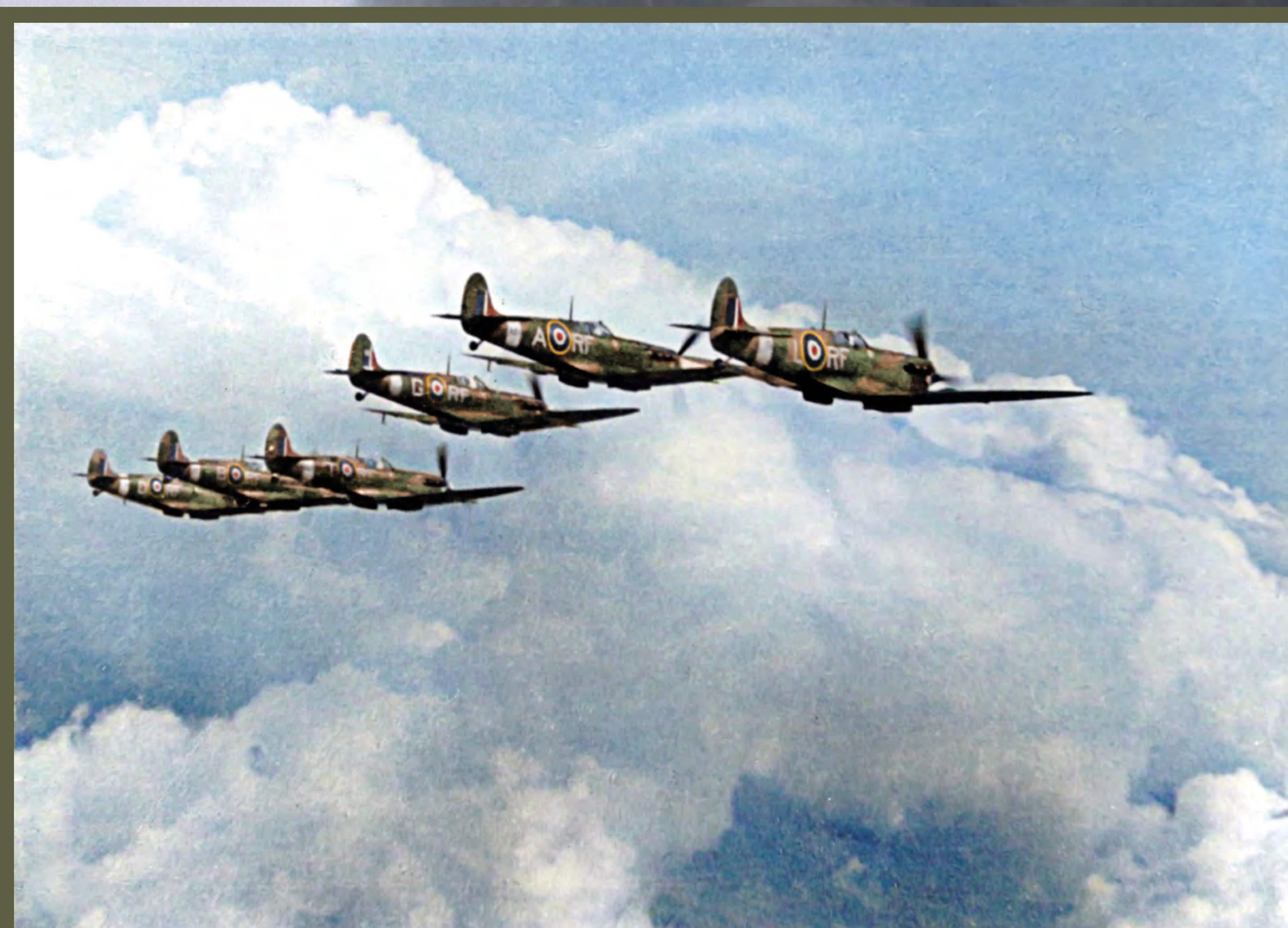
✈ Samoloty Dywizjonu Myśliwskiego 303, Wielka Brytania, 1942 r.

On the order of the Supreme Commander General Władysław Sikorski, the I Corps of the Polish Armed Forces was formed. Polish air squadrons took part in the Battle of Britain. Poles joined the fight when the world's biggest air battle entered a decisive phase. The Allied forces prevailed because of airmen from many German-occupied countries who joined the fight. Thanks to their sacrifices, it was possible to stop the invasion of Britain.