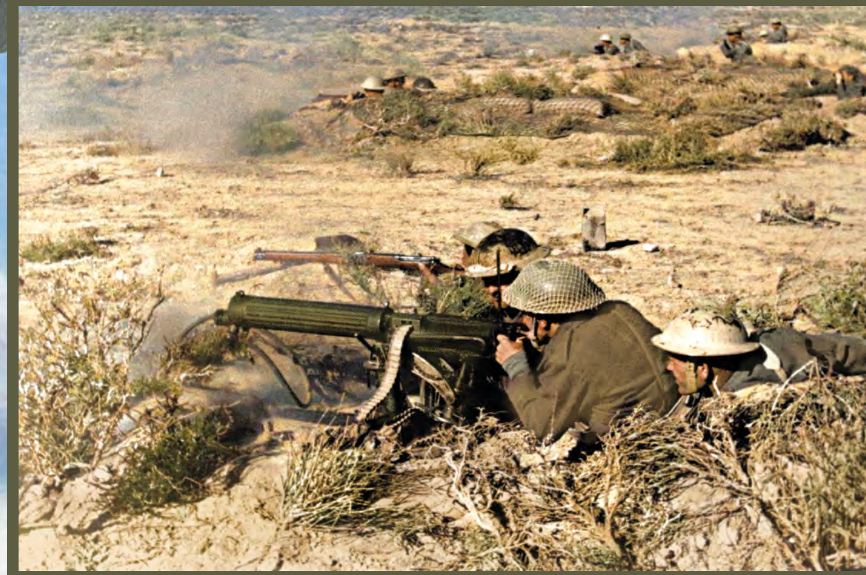
📍 Żołnierze Samodzielnej Brygady Strzelców Karpackich na pierwszej linii frontu na pustyni pod Tobrukiem. Libia, grudzień 1941 r.

The destruction at Pearl Harbor after the Japanese air raid of 7 December 1941