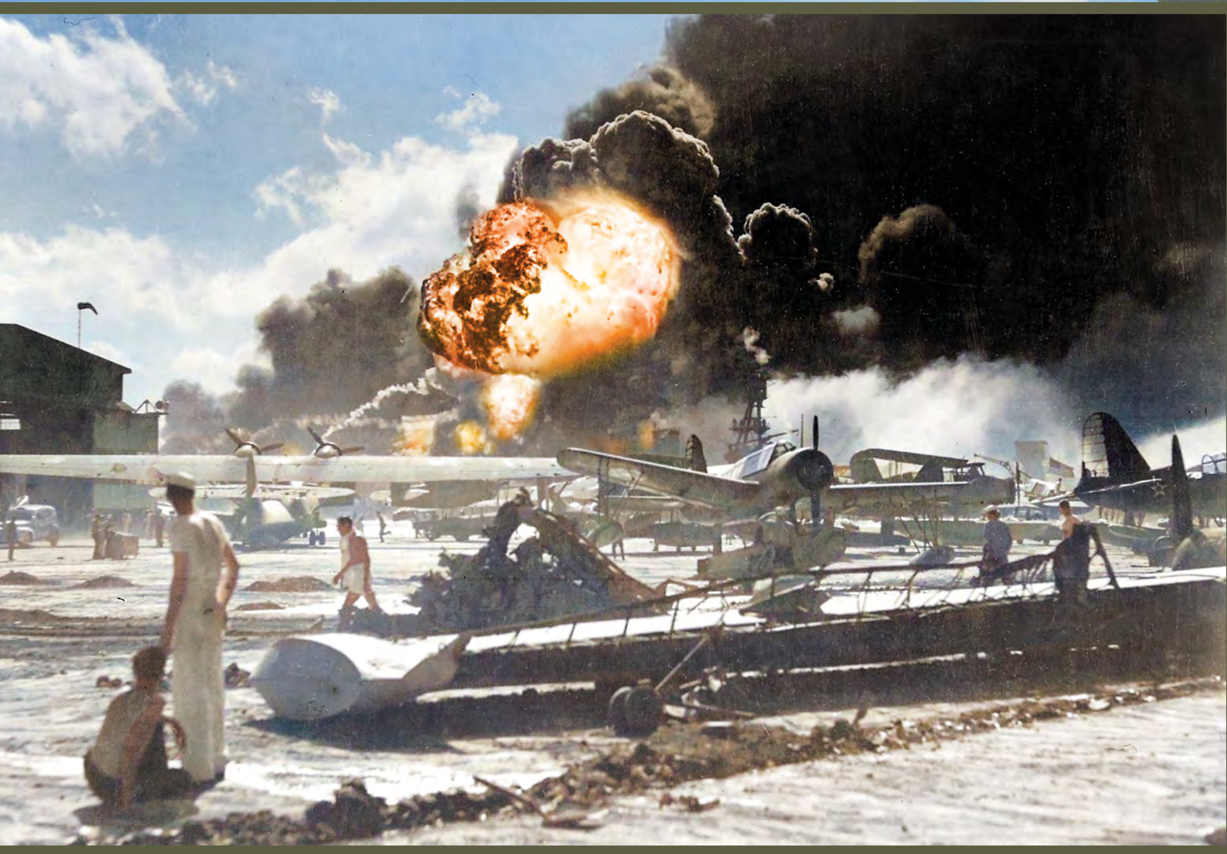
📍 Zniszczenia w Pearl Harbor po japońskim nalocie 7 grudnia 1941 r.

In December 1941, the United States entered the war, which changed the balance of power on the front. Now the war extended to nearly every corner of the world.