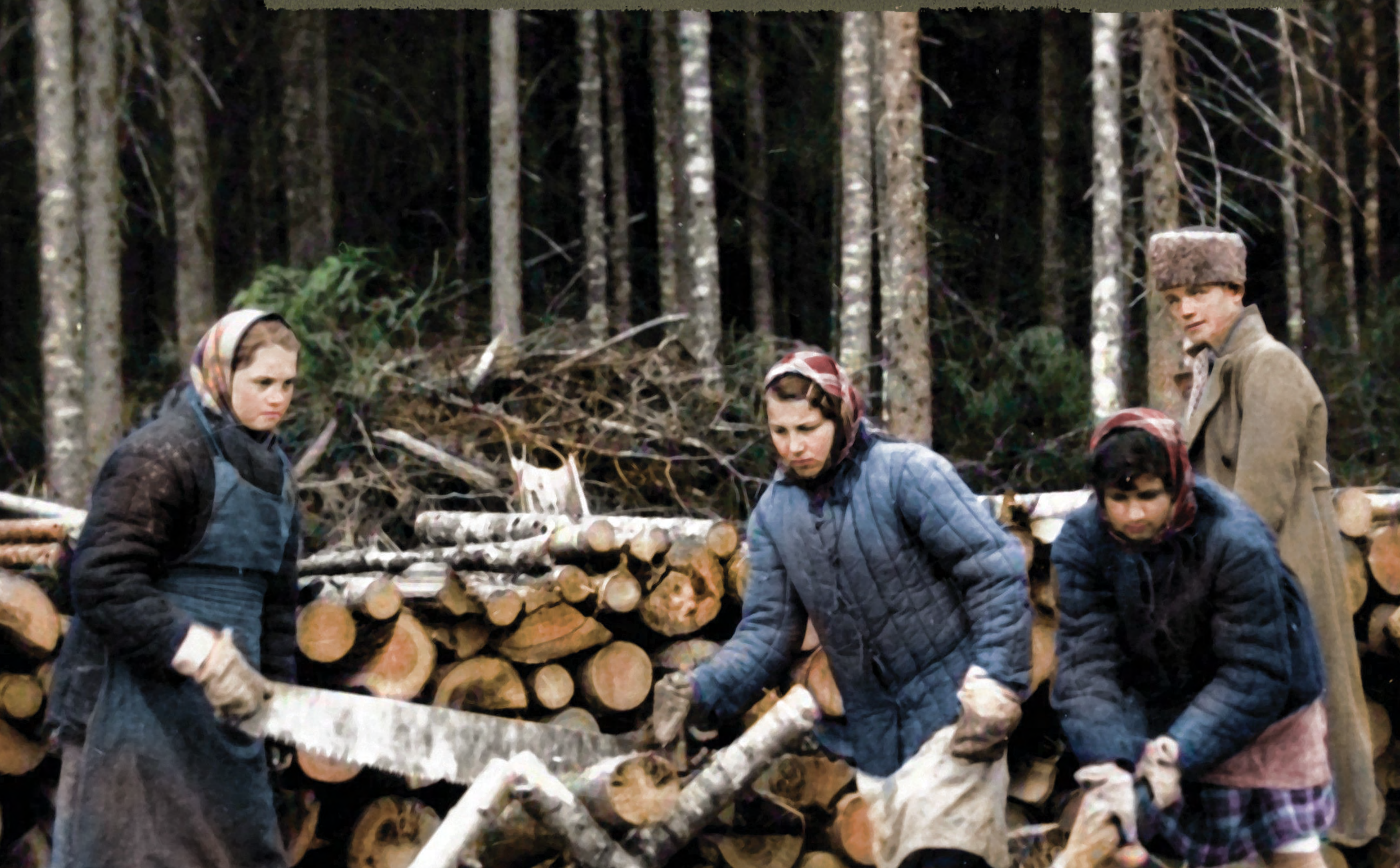
Grupa kobiet pracujących przy wyrobie lasu w okolicach Swierdłowska w ZSRS, 22 listopada 1940 r.

Polish soldiers and police officers interned by the Soviets in 1939 were transported to special NKVD camps in Kozelsk, Starobelsk, and Ostashkov, and subsequently killed as part of the Katyn Massacre, which was ordered by the highest Soviet authorities on 5 March 1940.