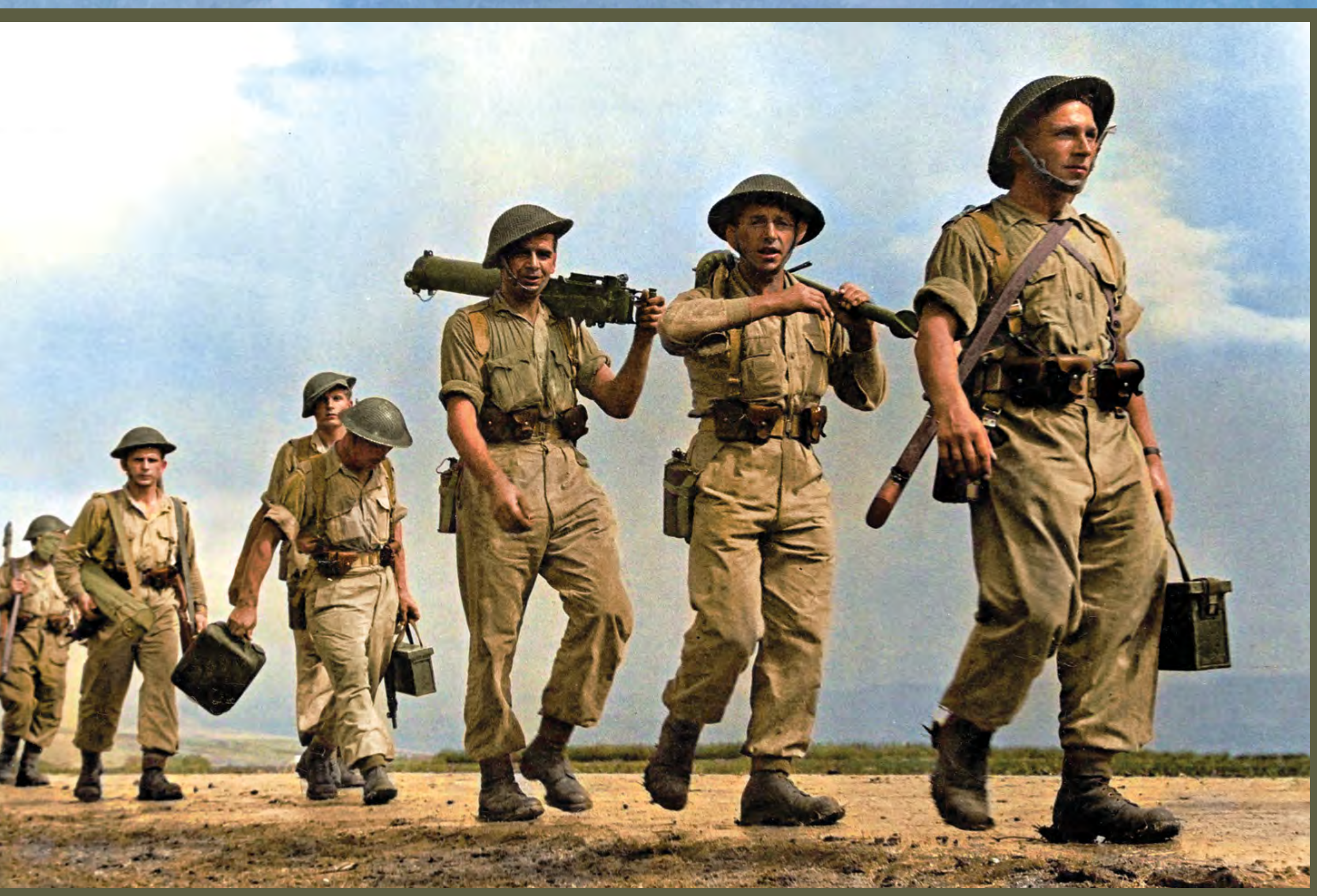
Żołnierze Armii Polskiej na Wschodzie w drodze na ćwiczenia

Soldiers of the Polish Army in the East on their way to military exercises