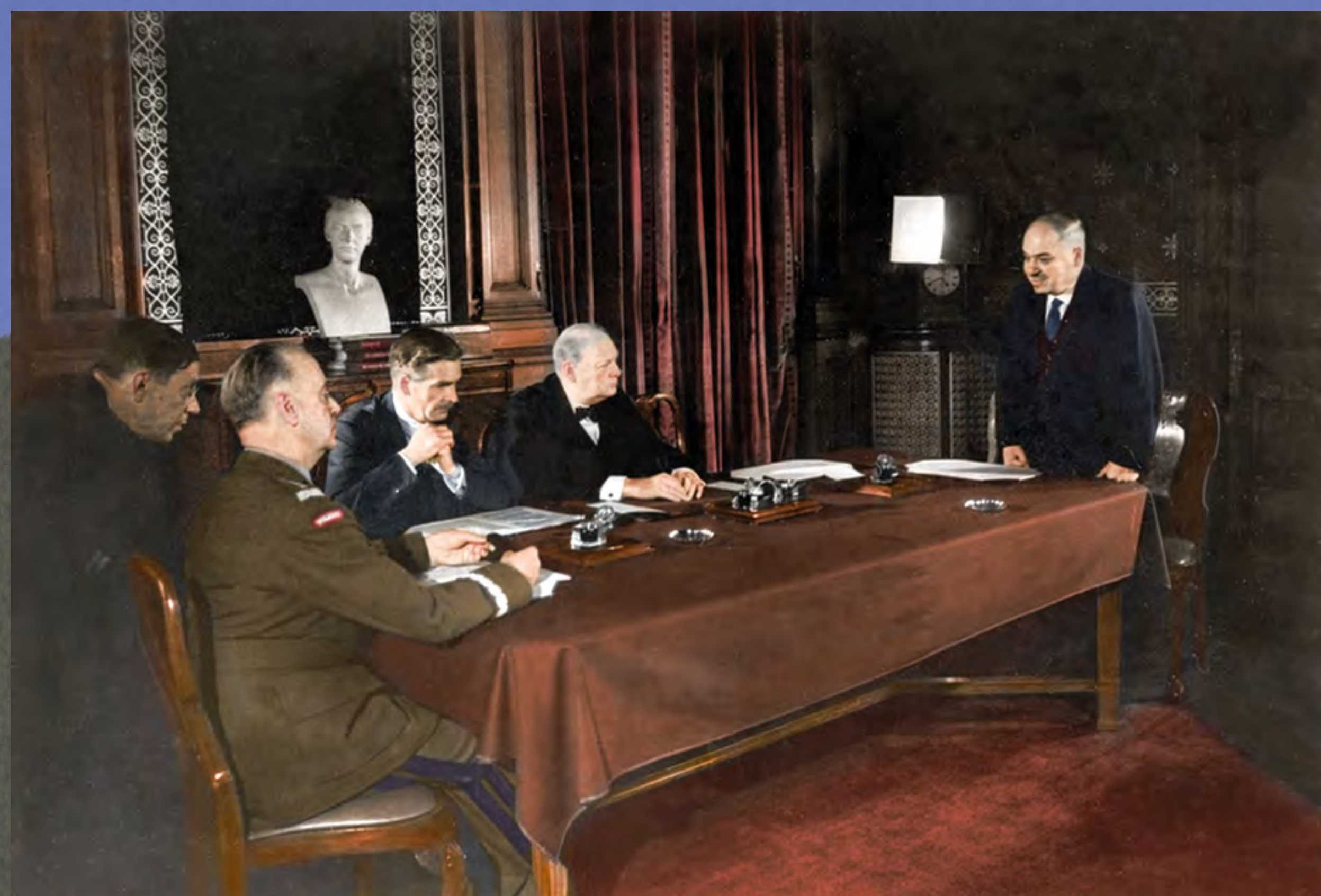
Podpisanie układu Sikorski-Majski, przywracającego stosunki dyplomatyczne między Polską a ZSRS. Londyn, 30 VII 1941 r.

The signing of the Sikorski-Majski Agreement reinstating diplomatic relations between Poland and the USSR. London, 30 July 1941